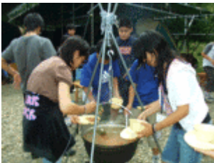
子どもたちによるエコクッキング